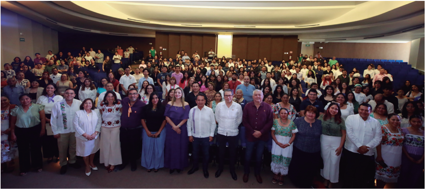
Junp'éel péektsil ku beetik le u noj mola'ay Congreso, le Instituto Investigaciones Legislativas nupa'an yéetel le múuch'kabil Comunidad Biocultural Kuxa'an, A.C.

Ikil u tojtáanta'al le u chíikbesa'al le seen toopil ku muk'yajtik xko'olelo'ob tu'ux kajakbalo'ob yéetel u pau'taanil ti'al ma' u suukta'l yila'al bey mixaa'alob tu k'iinil 27 ti' febrero beeta'ab junp'ée cha'anil animado “Teene' in K'a abae' Martha” (Mi nombre es Martha) yiknal le auditorio Dr. Eduardo Urzaiz Rodríguez ti' le Campus de Ciencias Sociales, Económico-Administrativas y Humanidades ti' le najil xook Universidad Autónoma de Yucatán (UADY).