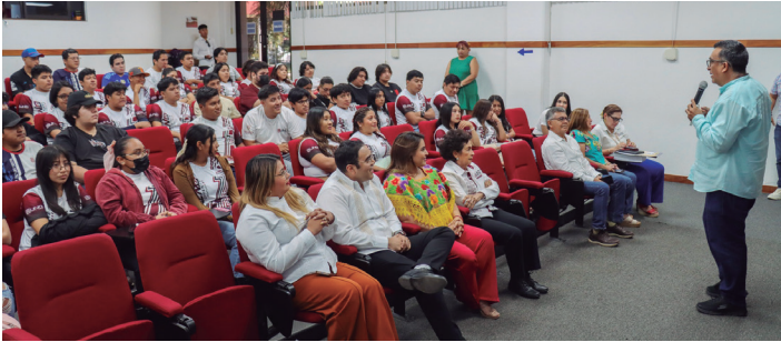
Campaña bisa'ab ti' le estudiantes ti' nivel superior, yéetel instituciones tu kaajil Jo' yéetel way tu lu'umil Yucatán.

Ikil u tojtpáanta'al le u bisa'al t'aa, yéetel paklamtsikbalil ti' le toopil ku máansik xko'olelo'ob, le u kaláantikubaob yéetel u tsikbe'enta'al u derechos humanos, tu wináalil marzo, le u noj mola'ay Congresoi Yucatán, le Institutoi Investigaciones Legislativas, yéetel le Comunidad Biocultural Kuxa' an tu biso'ob ch'a'antbij le cortometraje yiknal jejeláas universidades way tu lu'umil Yucatán.