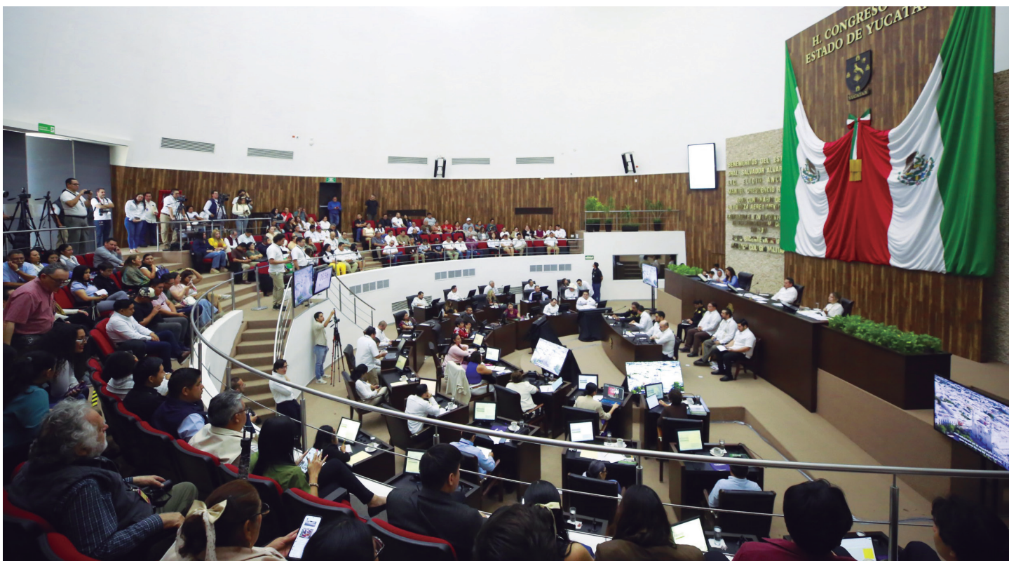
Le comparencias beeta'ab ti' kamp'éel bloques tu k'iinilo'ob 11 tak 13 ti' febrero.

Ichil le ejercicio ti'al rendición ti' cuentas le legisladores tu káaso'ob u xaa'k'alil le resultados ti' le u meyaj le administración estatal, tu k'iinil 11 tak 13 ti' febrero úuch le comparencias aktáan congreso le Tiulares ti' dependencias estatales, ikil u káasa'ala u xak'alata'al le u yáax Primer Informe u meyaj Jala'achil aktáan Pleno ti' le Congreso. Yiknal le Recinto Legislativo t'ana le responsables ti' áreas estratégicas ti' Jala'achil ti'al u tosol'ob yéetel u k'ubo'ob le información jets'a'ab ichil le yáax informe bety xan tu núuko'ob le k'áatchi' beeta'an tumeen le jejeláas diputados ti' le partidos políticos.