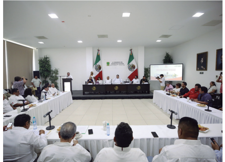
Táakpaj autoridades municipales yéetel estatales ti' movilidad yéetel desarrollo urbano, bey xan representantes ti' organizaciones ti'al transportistas.