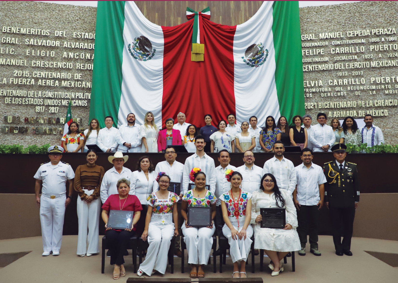
Yáax kajnáalo'ob recipiendarias ti' le chímpolal reconocimiento al Mérito Juvenil “Efraín Calderón Lara” ti' le H. Congreso Yucatán.

Aktáan Sesión Solemne tu k'iinil 19 ti' febrero, le LXIV (64) Legislaturai ti' u Congreso Yucatán tu k'ubaj yáax juntpeenakil le chímpolal Reconocimiento al Mérito Juvenil “Efraín Calderón Lara” chímpolal ku náajalta'al tumen táankelemo'ob táaj uts u meyajtik'o'ob ba'axo'ob ti' le ámbitos académico, deportivo, cultural, social, bey xan innovación yéetel emprendimiento.