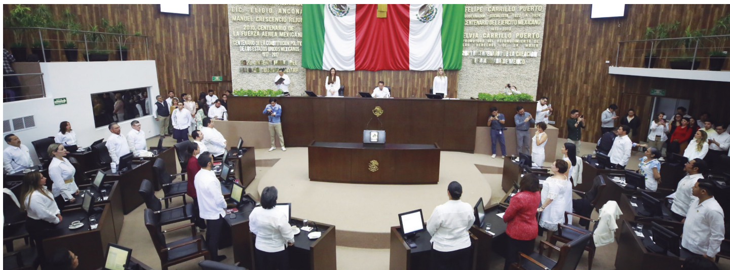
Segundo Periodo ku káax tu yáax k'iinil 1 febrero tak 31 ti' mayo ti' le ja'aba'.

Yéetel le payt'aanil ti'al múulmeyajil ti'al u yutsil kajnáalo'ob way tu lu'umil Yucatán, bejla ekáaj le Segundo Período Ordinarioi Sesiones ti' le u Congresoi u lu'umil Yucatán ti' le u ka'a ja'abil meyajil Constitucional, kun káajal tu yáax k'iinil febrero kun xuulbal tak 31 ti' mayo ti' le u ja'abil 2026.