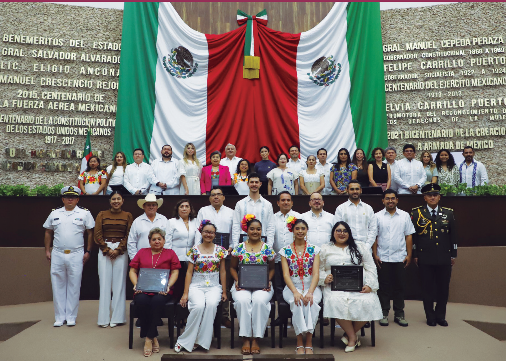
Primeras personas beneficiarias del reconocimiento al Mérito Juvenil “Efraín Calderón Lara” del H. Congreso del Estado de Yucatán.

En Sesión Solemne de fecha 19 de febrero, la LXIV (64) Legislatura del Congreso del Estado de Yucatán entregó por primera vez el Reconocimiento al Mérito Juvenil “Efraín Calderón Lara” galardón que distingue a jóvenes yucatecos por su trayectoria y aportaciones en los ámbitos académico, deportivo, cultural, social, así como en innovación y emprendimiento.