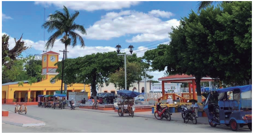
Tekal de Venegas se convirtió en municipio el 30 de diciembre 1930.