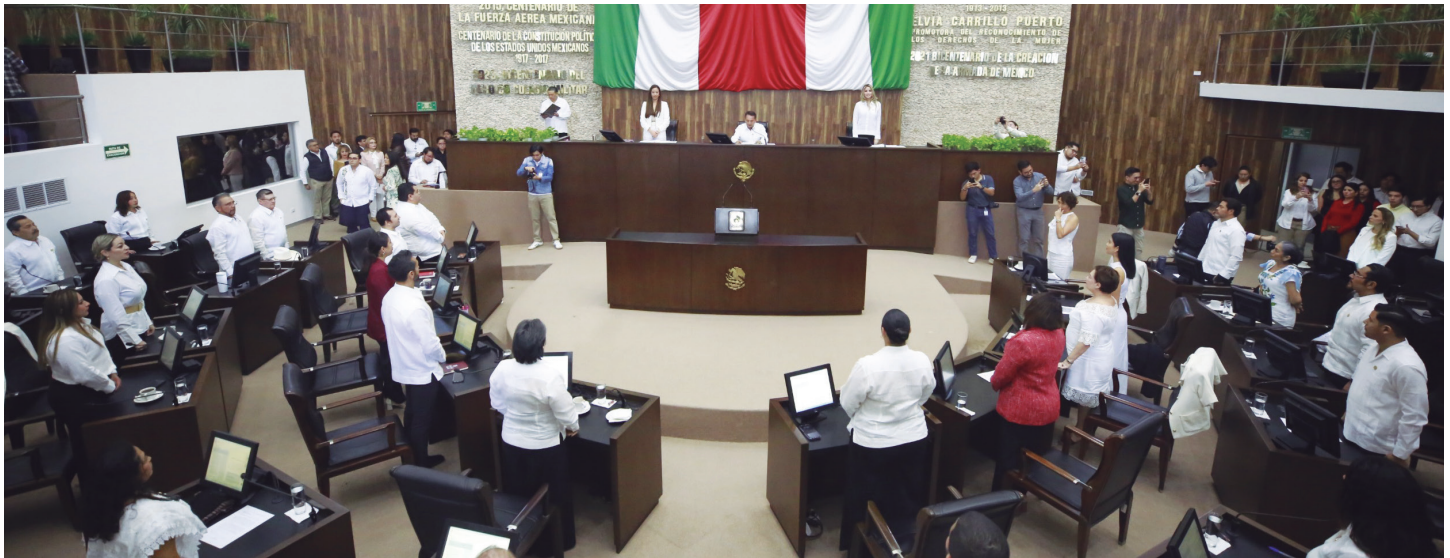
El Segundo Periodo comprenderá del 1 de febrero al 31 de mayo del año en curso.

Con un llamado a trabajar coordinados para beneficio de la ciudadanía de Yucatán, dio inicio el Segundo Período Ordinario de Sesiones del Congreso del Estado, correspondiente al Segundo Año de Ejercicio Constitucional, que se desarrolla del 1 de febrero al 31 de mayo del presente año.