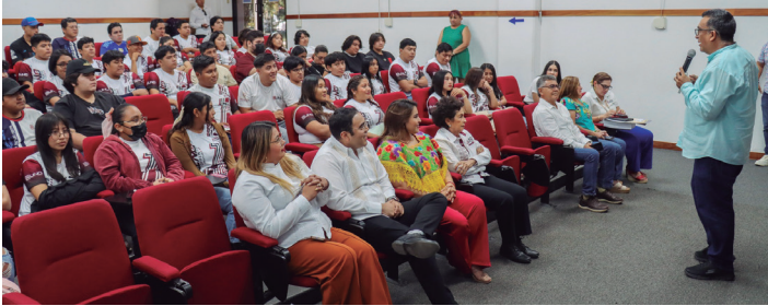
La campaña se presentó a estudiantes de nivel superior, en instituciones de Mérida y el interior del estado.

Con el objeto de promover la sensibilización, diálogo y análisis en torno a las violencias que enfrentan las mujeres, así como fomentar la prevención, corresponsabilidad social y el respeto de sus derechos humanos, durante el mes de marzo, el Congreso del Estado a través del Instituto de Investigaciones Legislativas, y la Comunidad Bicultural Kuxa'an presentaron el cortometraje en diversas universidades del estado.